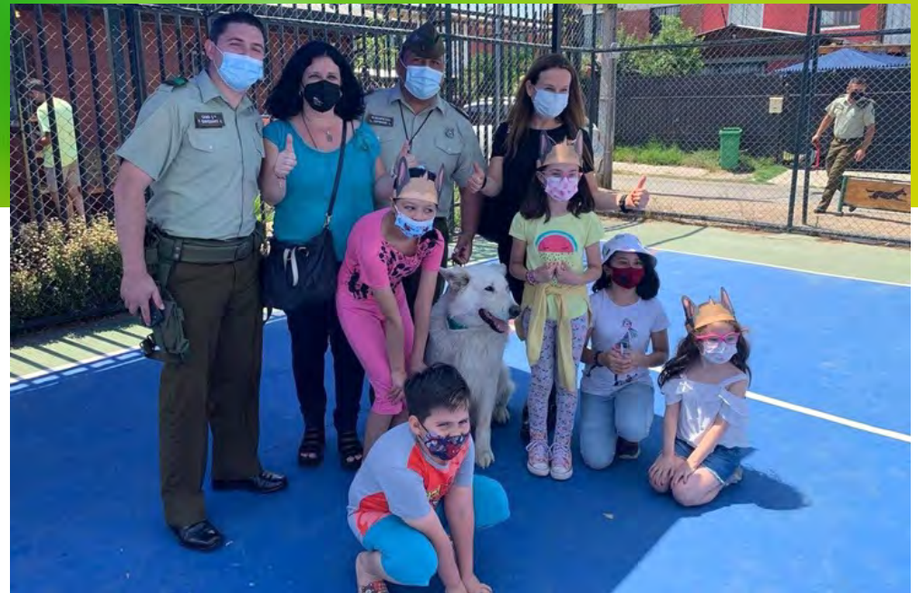
Desde el año 2021 se celebra la fiesta de Navidad en Villa Andes del Sur en Puente Alto con una gran participación de Carabineros junto a la comunidad local.

Agradecimientos a expertos de Carabineros de Chile como lo son los analistas que trabajan hoy en día en las oficinas de operaciones de las diferentes unidades de carabineros de Chile por apoyar en esta publicación.