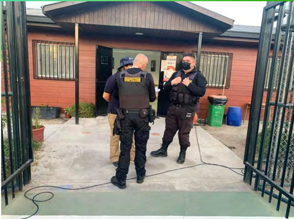
Inspectores municipales de Puente Alto en alianza con comunidad local y carabineros de Chile de comisaría 38.

En Villa Andes del Sur, en el marco del Plan Maestro CPTED iniciado el año 2021 se han estrechado los lazos entre la comunidad, la policía y el municipio.