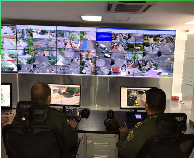
Central de cámaras de Municipalidad de Puente Alto en la Dirección de Seguridad Pública, trabajando el monitoreo de actividades ilícitas para activar protocolos de respuesta.