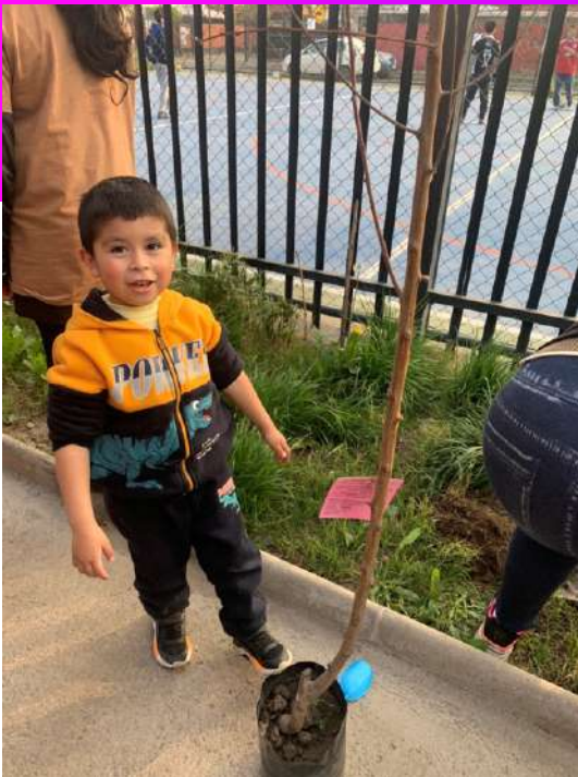
Iniciativa de taller para plantar árboles en sede comunitaria Salvador San Fuentes como hito del diagnóstico Nube de Sueños.