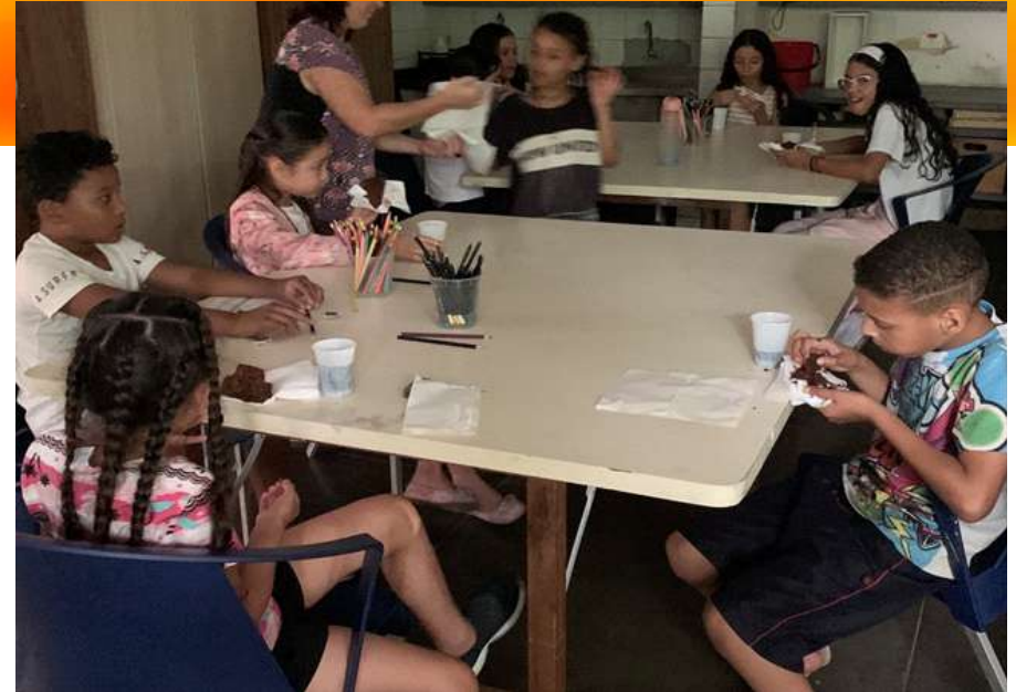
Esta foto muestra la dinámica del taller de Nube de Sueños en Sao Paulo donde se sienta a niños y niñas entorno a una mesa cada una con una cartulina en blanco y la oferta de diversos lápices de colores.