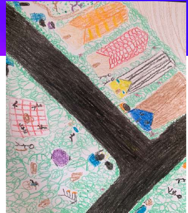
Sueño de niña de 7 años de Andes del Sur en Puente Alto con áreas verdes, asfalto en las calles de alta calidad y juegos infantiles.

Uno de los casos emblemáticos es el de la Municipalidad de Puente Alto en Chile, que desde el año 2000 ha aplicado sostenidamente la metodología CPTED.