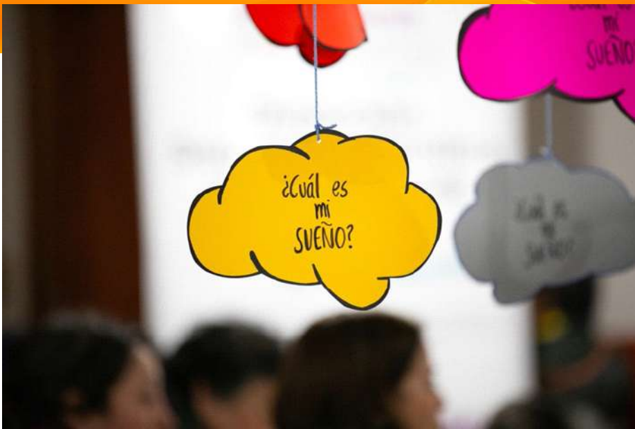
Taller de Nube de Sueños realizado en Población el Canelo de Puerto Varas el año 2023 en Puerto Varas.

La metodología CPTED (Crime Prevention Through Environmental Design) desarrolla desde el año 2005 una herramienta de diagnóstico conocida como la Nube de los Sueños CPTED.