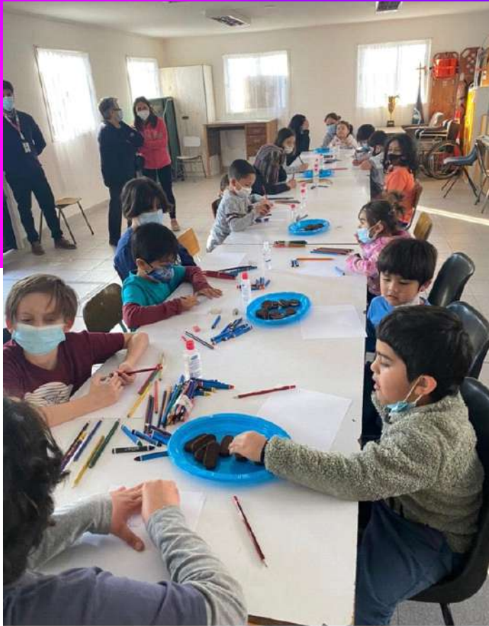
Nube de Sueño realizada con niños y niñas de Andes del Sue en Puente Alto en 2022 post pandemia para detectar niveles de salud mental.