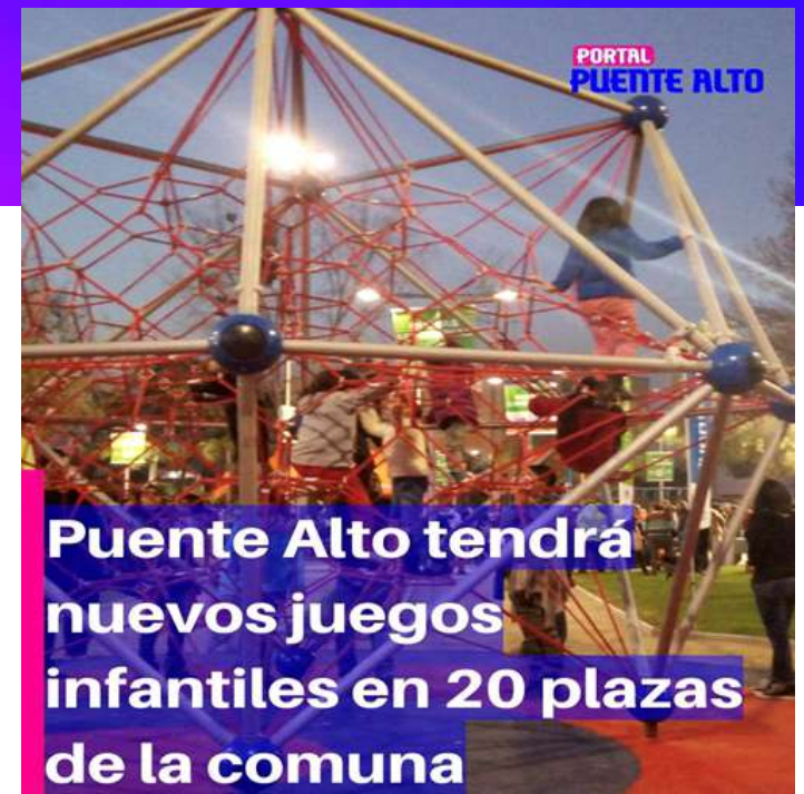
La comuna ha invertido en la construcción sostenidas de muchas plazas inclusivas.