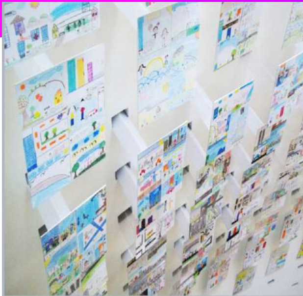
Nube de Sueños en México año 2012 expuesta en la Universidad Ibero Americana en Ciudad de México.

En diversas comunas de la América Latina se ha aplicado desde hace varios años como herramienta diagnóstica la Nube de Sueños con posteriores intervenciones CPTED.