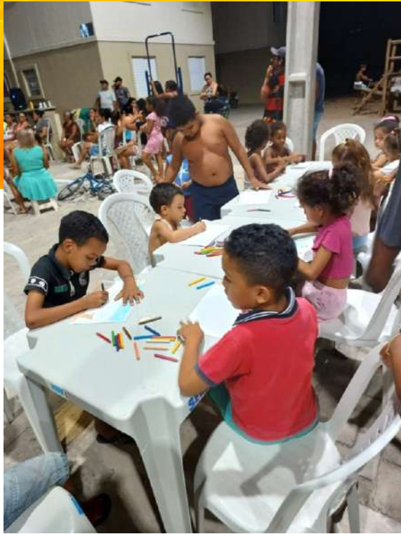
La metodología de Nube de Sueños se ha extendido por toda América Latina. Esta foto muestra un taller de Nube realizado en el Norte de Brasil en una ciudad llamada Juazeiro do Norte con niñas y niños de esa ciudad.