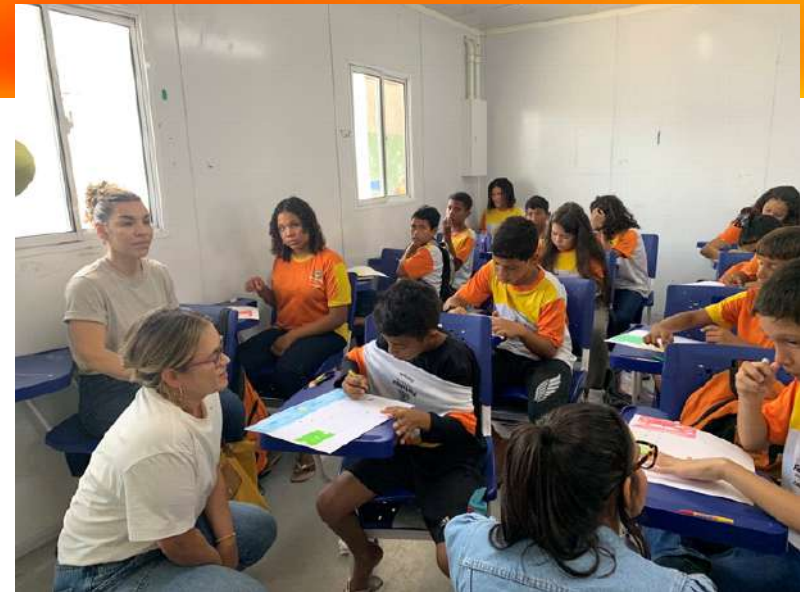
También en la ciudad brasilera de Fortaleza se ha aplicado con éxito la Nube de Sueños lográndose obtener información ambiental de gran calidad para la posterior implementación de proyectos.