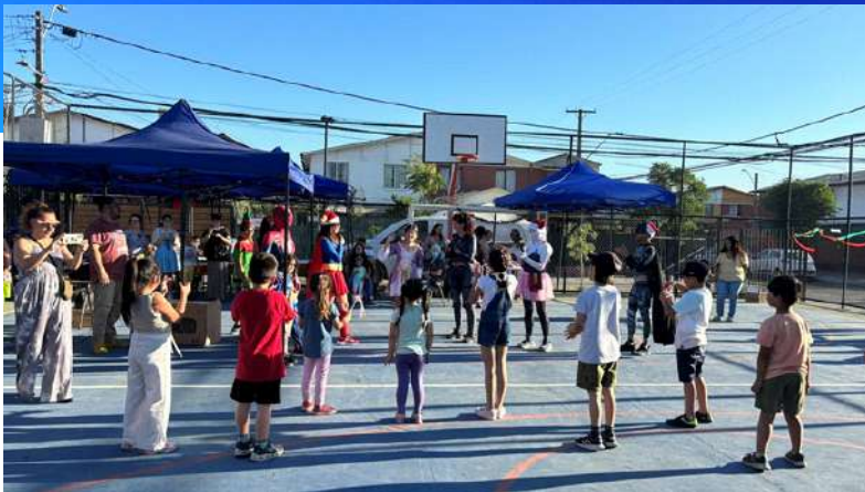
Fiesta de Navidad en Villa Andes del Sur, Puente Alto 2023.

La prevención temprana de la violencia y el delito es clave para la construcción de comunidades más seguras. Desde la promulgación de los derechos del niño el 20 de noviembre de 1989 por la Asamblea General de Naciones Unidas existe una mayor conciencia a nivel global de que los niños tienen una voz que debe ser oída y esto ha representado un gran cambio la última década especialmente en el cumplimiento de sus derechos fundamentales.