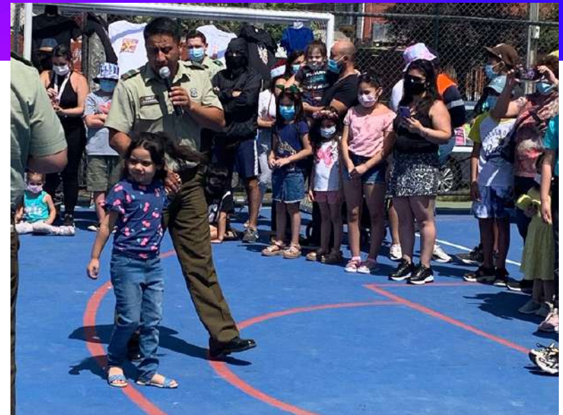
Fiesta de Navidad realizada en diciembre de 2022 como hito para elevar niveles de salud mental en niños y niñas luego del diagnóstico realizado con Nube de Sueños en marzo del mismo año.