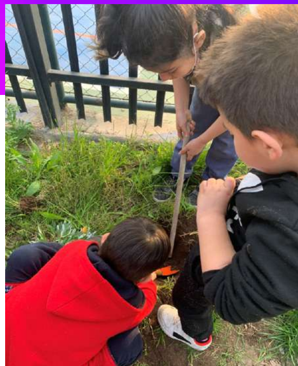
Iniciativa de taller para plantar árboles en sede comunitaria Salvador San Fuentes como hito del diagnóstico Nube de Sueños con gran participación de niños y niñas de la comunidad.