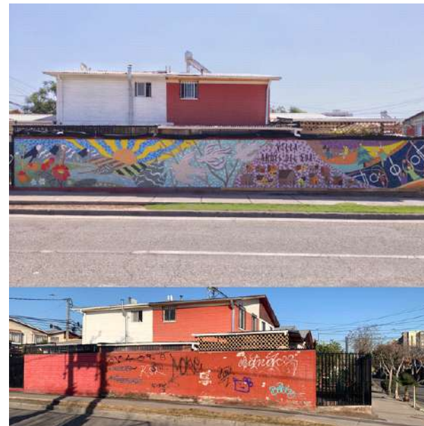
Mosaico en Villa Andes del Sur frente a la cancha antes y después (2022)