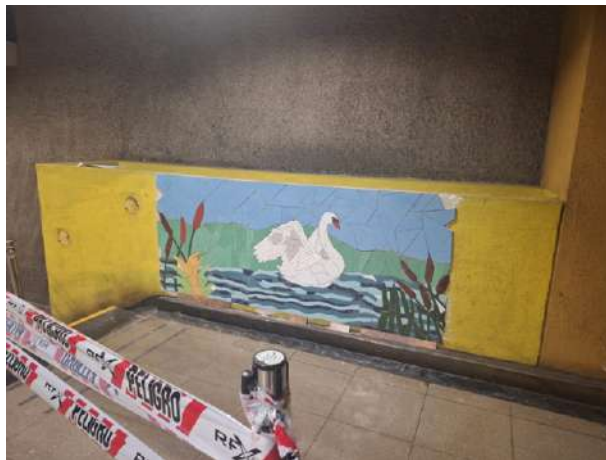
Mural en estación de Metro en Puente Alto.

En toda la comuna de Puente Alto ha primado la idea de que “Sin Comunidad no hay Seguridad”.