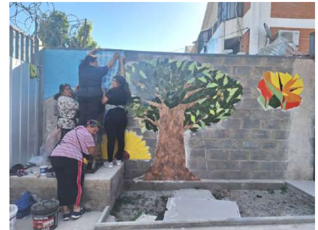
Mural Roble Viejo en Puente Alto.

Tal es el caso del Mural del Roble Viejo, y del Metro entre otros.