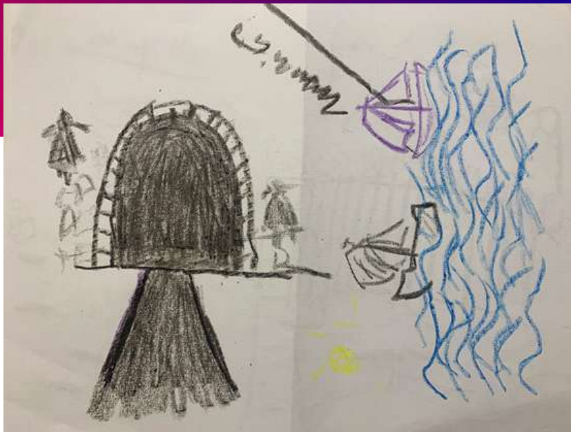
Dibujos del año 2021 que expresan angustia respecto al contexto COVID del 2020 pero esperanza también del futuro.