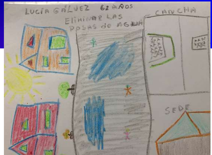
Detección de problemáticas ambientales a resolver por vecinas de Andes del Sur como posas de agua en calle Salvador Sanfuentes (2021)