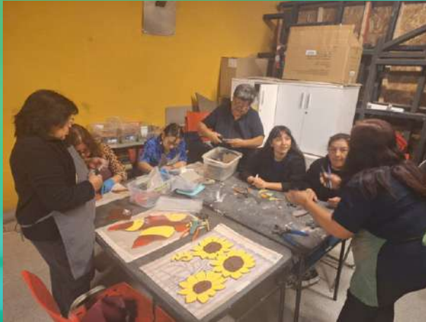
Taller Mural Roble Viejo.