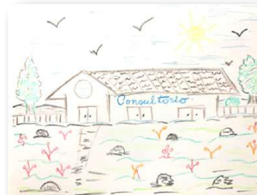
Imagen de dibujo de Nube de Sueño de 2021 inicial donde vecinas sueñan con apoyo médico en contexto post pandemia COVID

Instrumentos diagnósticos CPTED como La Nube de Sueños que es muy lúdica y participativa permiten acceder a esa información subconsciente y cualitativa que es muy rica para el desarrollo de estrategias locales de seguridad urbana.