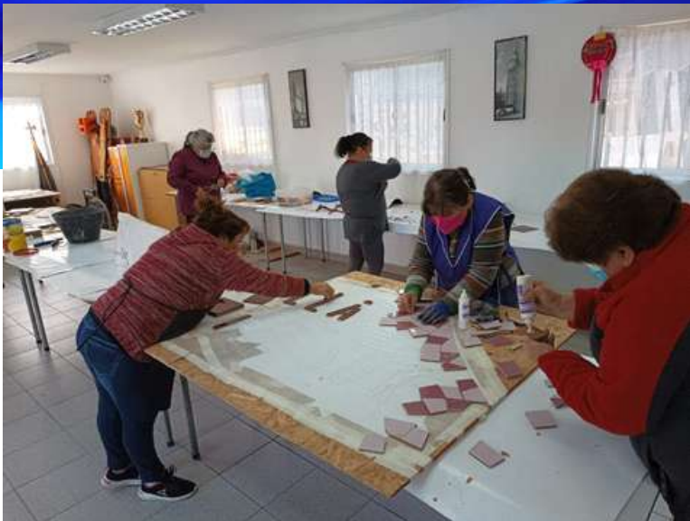
Trabajo de vecinas en Villa Andes del Sur con mosaico ya diseñado por el Departamento de Cultura Municipal.

La participación comunitaria es clave para la seguridad urbana desde muchos ángulos. Por una parte, las comunidades son las que más conocen sus propios problemas de inseguridad y delito por lo tanto esa información puede ser clave en el quehacer de las policías, investigaciones y gestión municipal para la seguridad urbana.