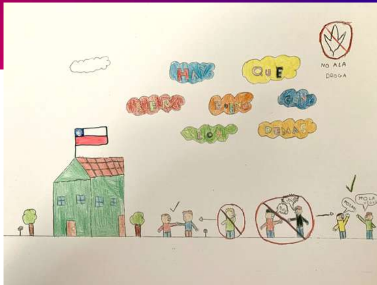
Sueño de vecina en Andes del Sur que no quiere más violencia y conflictos comunitarios en 2021. Muchos de estos conflictos se incrementaron durante pandemia COVID en 2020.