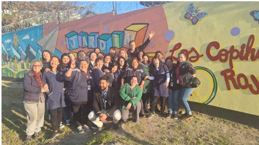
Mosaico Los Copihues Rojos.

También en la población Villa Carol Urzúa en Puente Alto se desarrollan talleres de Mosaico participativo.