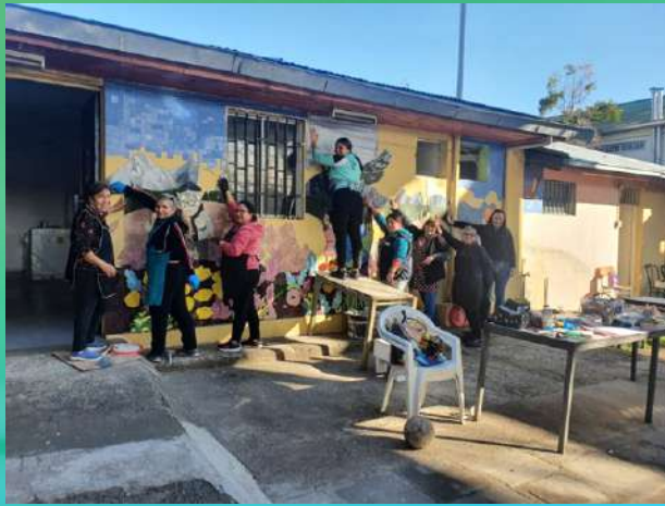
Taller de Mosaicos en Población Carol Urzúa.