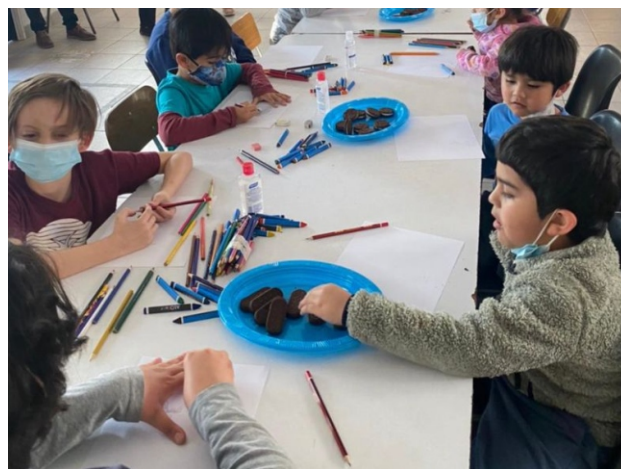
Primera Nube de Sueños realizada en Santiago de Chile año 2005

Debemos señalar que en cuanto a las componentes de esta tercera generación de CPTED, ya el año 2005 se estaban dando pasos en América Latina. La creación de la Nube de Sueños, metodología que con la participación de niños que dibujan su entorno para descubrir su percepción de seguridad en él, ya estaba investigando sobre sus emociones y ocultos sentimientos sobre como ellos sienten y viven su entorno, ya sea físico, pero también social.